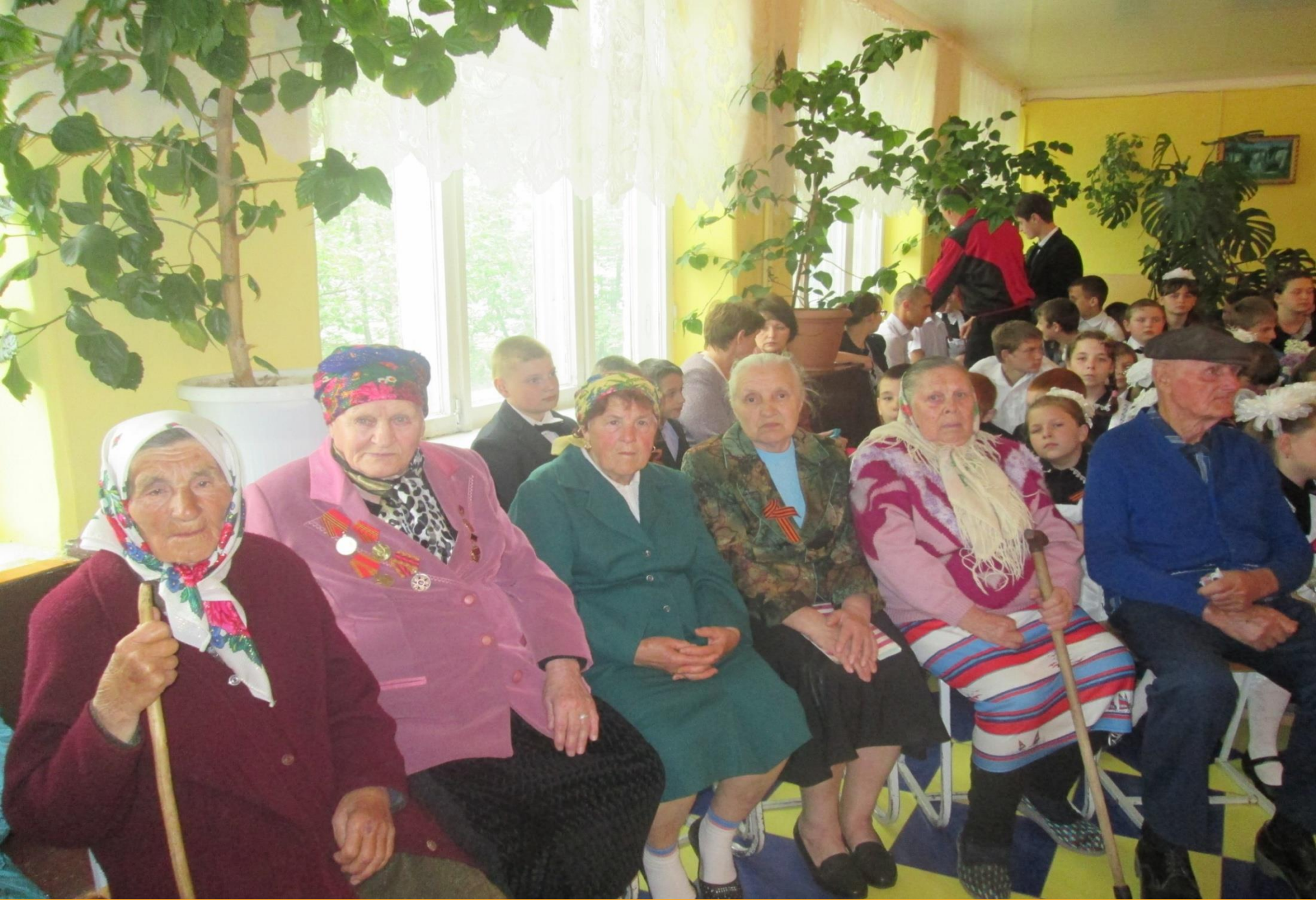
Встреча с Тружениками тыла